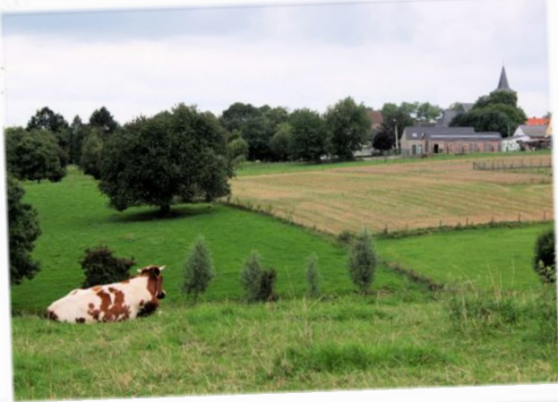
landschappen - Tom Martens

Tijdens de afgelopen Dorpsdag, werden de winnaars van de fotowedstrijd verkozen. We waren aangenaam verrast met de kwaliteit van de ingezonden foto's. De 4 foto's die gekozen werden als beste geven een heel goed beeld van de sfeer en het leven in Elst. Met dank aan alle inzendingen...!!!