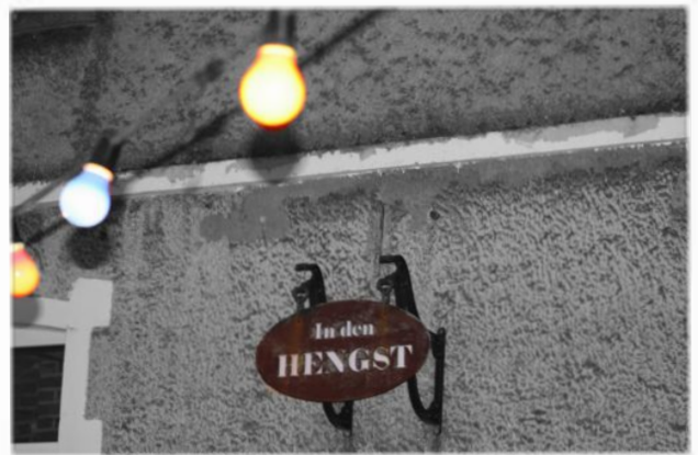
dorpsleven - Maureen De Brucker