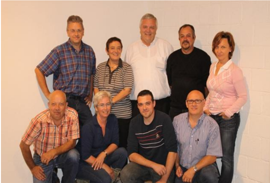
De acteurs en actrice samen met de regisseur en de co-regisseur

Toneelgroep Elsuth brengt op 27 en 28 november en 3 en 4 december 2010 de komedie 'The Sunshine Boys' op de planken. 'The Sunshine Boys' (1975) is één van de 38 toneelstukken van de Amerikaanse King of Comedy Neil Simon (New York °1927) en wordt nu gespeeld in Elst.