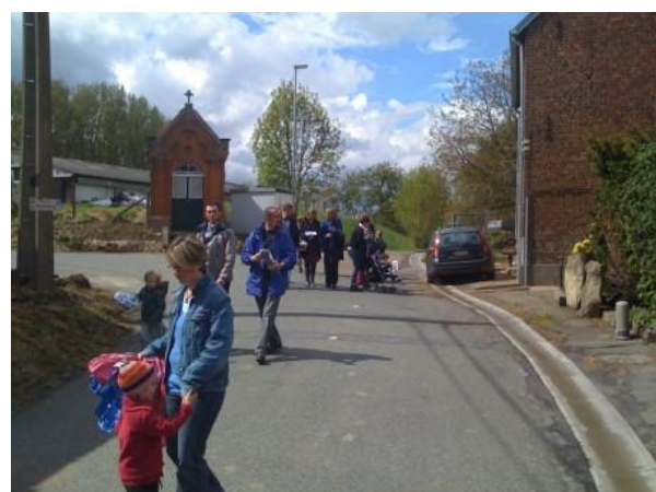
De wandelaars konden rekenen op een mooie dag met voldoende zon.