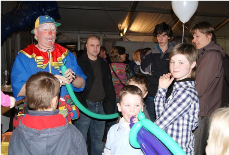
Er was ook animatie voor de kinderen voorzien.