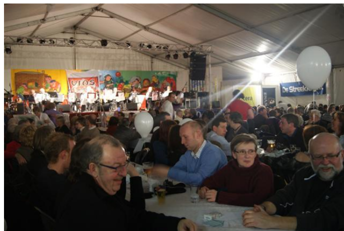
De gezellige feesttent