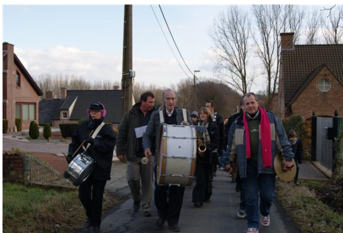
De kop van onze gelegenhededorpsfanfare

De dag zelf werden de beentjes een eerste keer gestrekt in de namiddag, onder een prachtig februarizonnetje. 270 wandelaars stapten een mooie tocht van een 4-tal kilometer, met een kleine maar krachtige fanfare op kop. Bij drie stopplaatsen werd er animatie en versnaperingen aangeboden: accordeonmuziek, warme wijn en chocolademelk, een “muilentrekker”, jazzy muziek, en ... de geutelingen mochten natuurlijk niet ontbreken. Die langgerekte stoet over de kronkelige baantjes te zien, was toch wel een aparte ervaring.