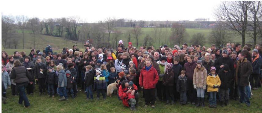
De grote groep wandelaars

Elst won vorig jaar de Vlaamse Prijs Dorp met Toekomst, en kreeg meteen een dorpsfeest cadeau. Op zaterdag 20 februari 2010 mochten de Elstenaars zich klaar maken voor een spetterende namiddag- en avondprogramma. Vooraf hadden vrijwilligers van Dorpsforum Elst bij elk huis aangebeld om het programma met de verschillende activiteiten uit te leggen en de inschrijvingen te regelen.